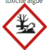
Dangers pour l'environnement