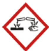
Danger de corrosion