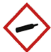
Gaz sous pression