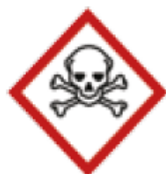
Danger de toxicité aiguë