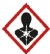
Dangers graves pour la santé