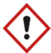
Dangers pour la santé